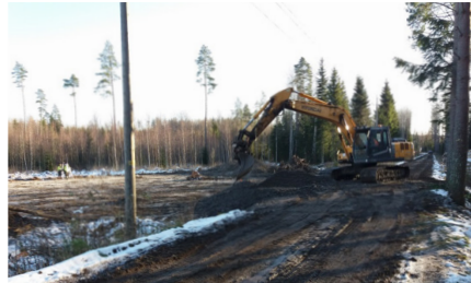
Koepenkeren rakennustyöt ovat alkaneet Kujalassa.

Tällä viikolla on pidetty tunneliryhmän kokous 2, Vt12 viestintäpalaveri ja mietitty työnaikaisia liikennejärjestelyitä. Kujalassa on käynnistynyt puiden kaato sekä koerakentamiseen liittyvät työt. Tällä viikolla koepenke- reiden kohdalta on poistettu pinta- maita ja instrumentoinnin asennus- työt on aloitettu. Pohjaveden antoi- suus- ja koepumppaukset on aloitettu Launeella.