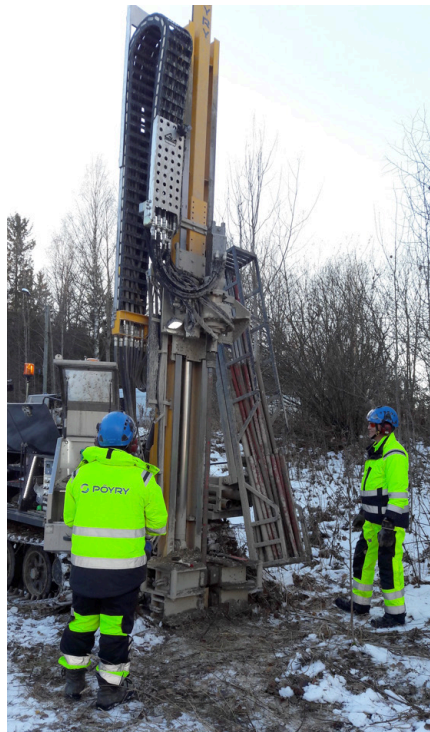
Pohjavesiputken asennus Launeella.