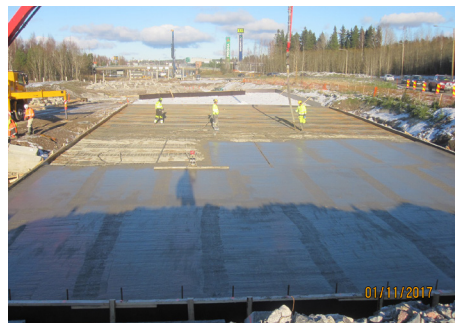
Launeen risteyssillan paalulaatan valu.