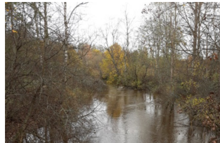
Porvoonjoki. Kuva maisemaryhmän maastokäynniltä.