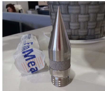
Koerakenteen instrumentoinnissa käytettävä huokospainekärki.