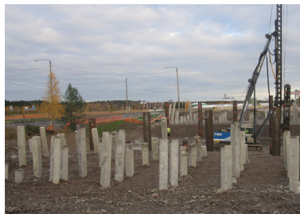
Sillan paalutustyöt etenevät Renkomäen ABC:n kohdalla.