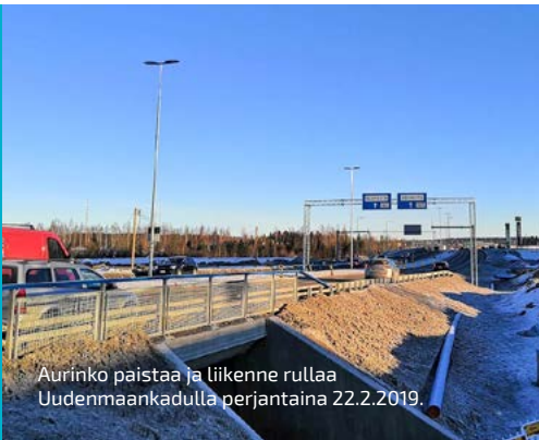
Aurinko paistaa ja liikenne rullaa Uudenmaankadulla perjantaina 22.2.2019.

VIIKON ONNISTUMISET: Kesän 2019 töiden suunnittelu etenee päivien pikkuhiljaa pidentyessä.