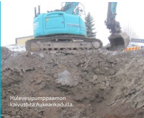
Hulevesipumppaamon kaivutöitä Aukeankadulla.

VIIKON ONNISTUMISET: Kesän 2019 töiden suunnittelu etenee.