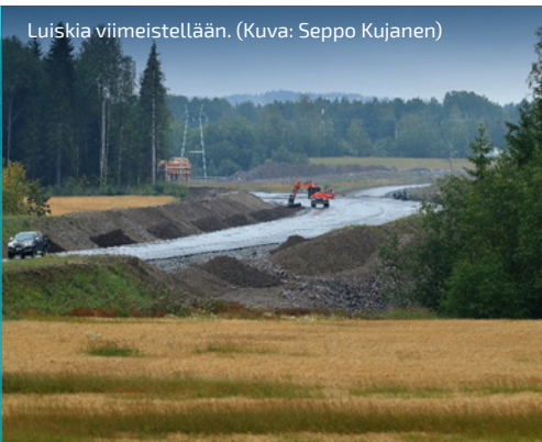
Luiskia viimeistellään.

VIIKON ONNISTUMISET: Luiskien viimeistely- työt etenevät hienosti.