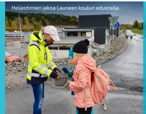
Heijastimien jakoa Launeen koulun edustalla.

VIIKON ONNISTUMISET: Lepolan ylikulku- sillan reunapalkin valu saatiin tehtyä viikko etuajassa!