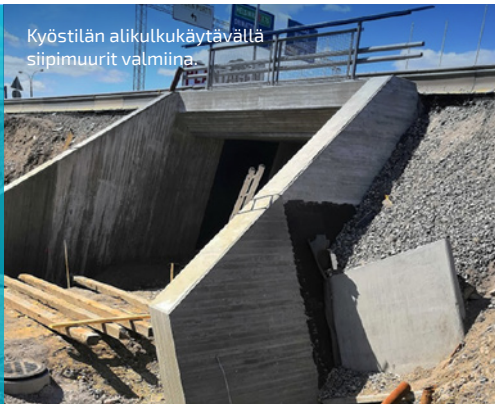
Kyöstilän alikulkukäytävällä siipimuurit valmiina.