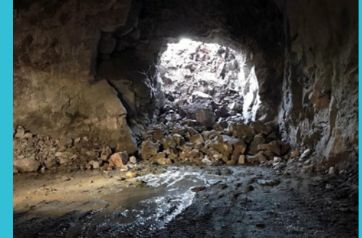
Liipolan tunnelin läntisen suuaukon puhkaisu on aloitettu.