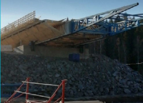
Luhdanjoen sillankansi valmiina tunkkaukseen.