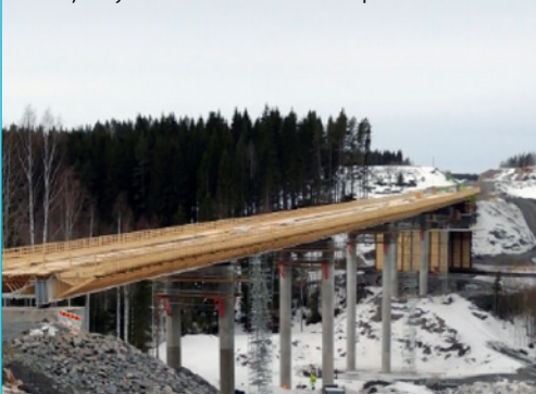
Vähäjoen ylikulkusillan teräsrakenne paikoillaan.

VIIKON ONNISTUMISET: 230 metriä pitkän Vähäjoen sillan teräsrakenne on siirretty paikoilleen!