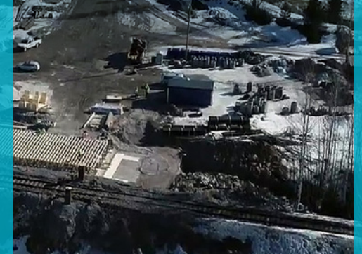
Pipon tuleva alikulkusilta.

VIIKON ONNISTUMISET: Pipon alikulkusillan muottitöiden käynnistyminen.