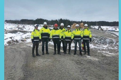
Vierailijat tutustumassa käynnissä oleviin rakennustöihin.