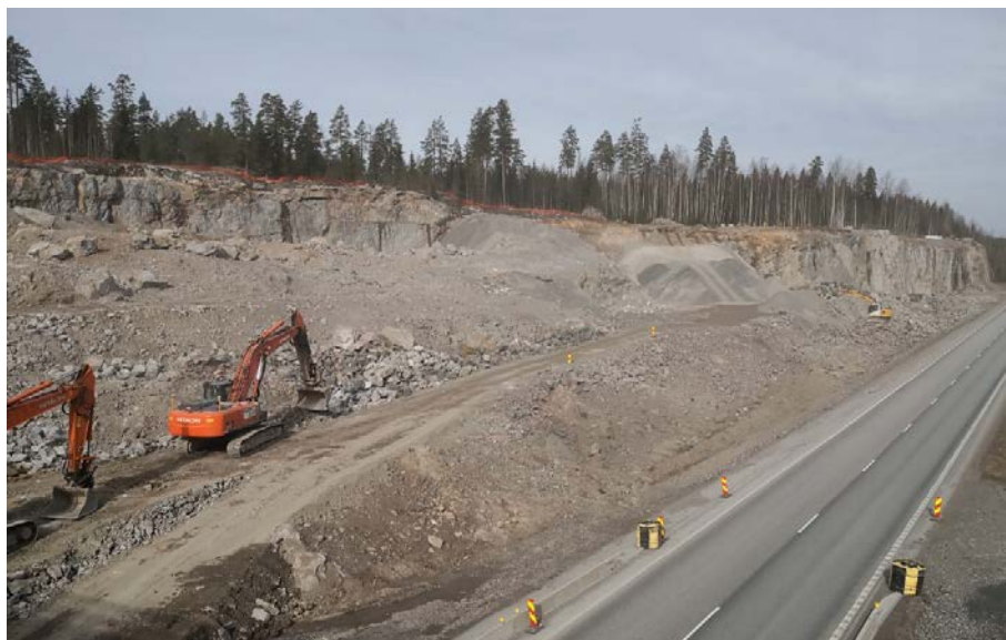
Kuva 2. Vt3 länsipuolen ramppien E5R3 ja R31 työt käynnissä.

Vt 3:lla on suoritettu asfaltin paikkauksia