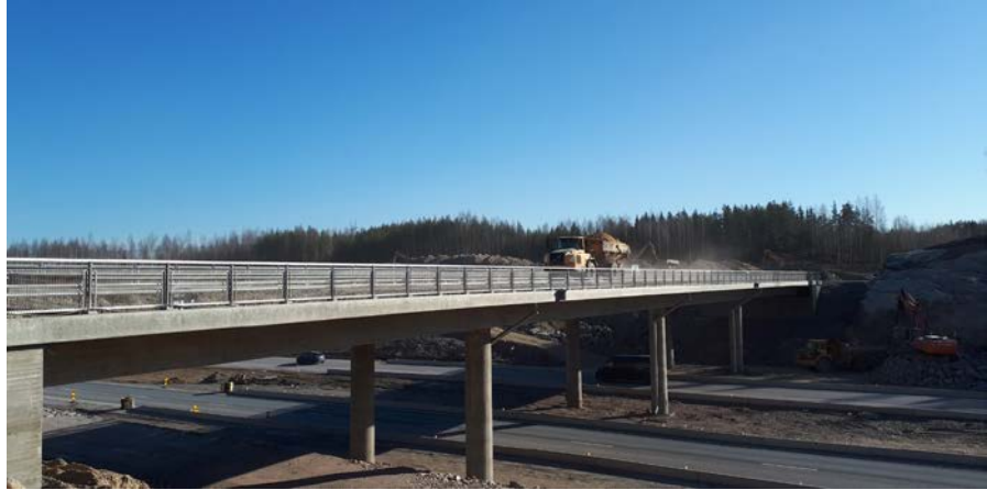
Kuva 1. Silta S5 työmaaliikenteen käytössä.