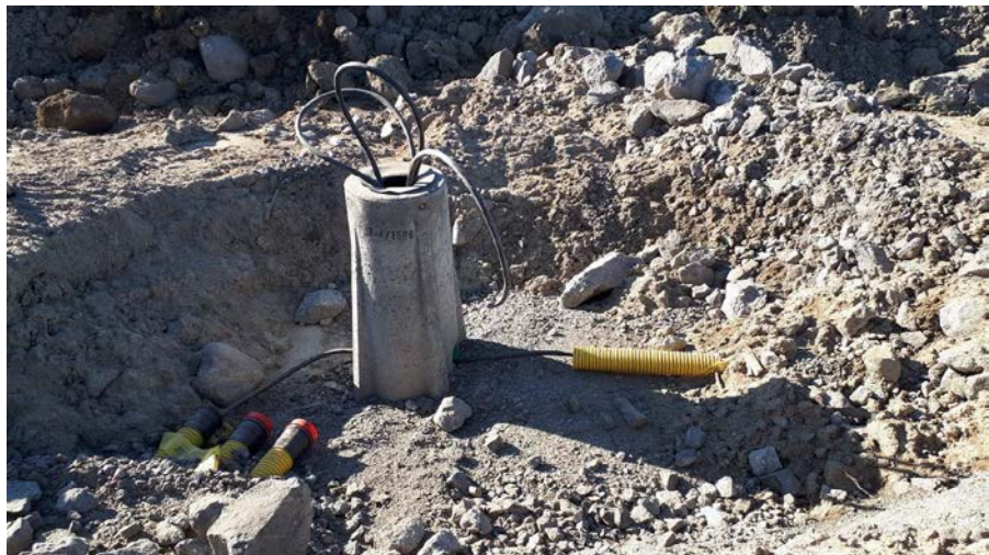
Kuva 3. Valaistusjalustoja ja kaapelointeja tehty.

Telematiikan ja valaistuksen putkituksien teko on jatkunut urakka-alueella maaliskuussa.