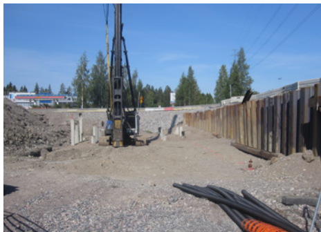
Aukeankadun alikulkukäytävän paalutus käynnissä.