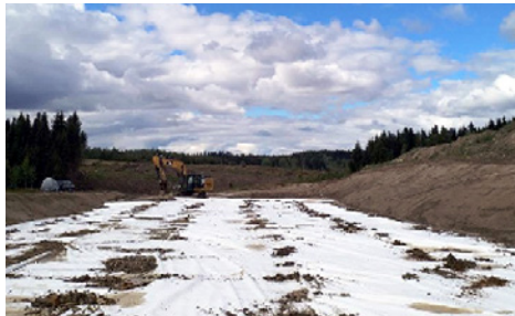
Kuvassa maaleikkaukspohjan päälle levitetty suodatinkangas.