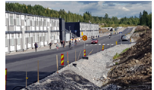
Koululaisia saapumassa Launeen kouluun Orvokkitietä pitkin.