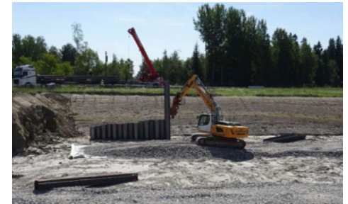
Pontitustyöt käynnistyivät Patomäessä alkuvuikosta.