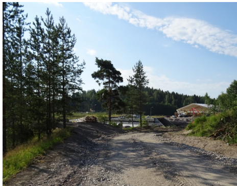
Uusi jalankulun ja pyöräilyn yhteys alkaa hahmottua Launeella.