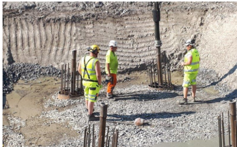
Kuvassa Vähäjoen ylikulkusillan anturan porapaalujen valu.