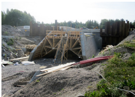
Kangasmäen alikulkukäytävän muotin purkutyöt käynnissä.