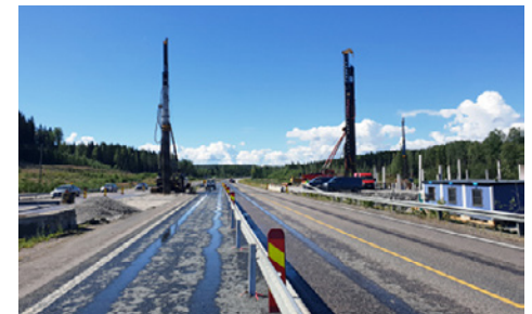
Lotilan risteyssillan paalutustyöt käynnissä Vt 4:n varrella.