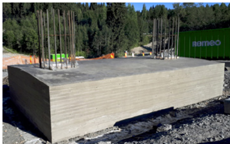
Kuvassa Vähäjoen ylikulkusillan ensimmäisenä valmistunut antura.