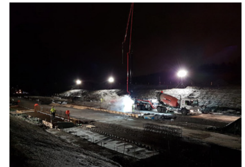
Valu käynnissä tulevalla Patomäen tunnelilla.