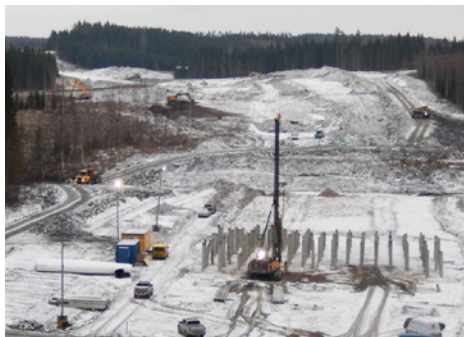
Kuvassa keveän lumipeitteen saanut Takamaa.