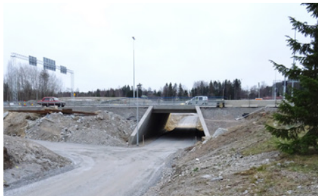
Orimattilankadun alikukäytävä on nyt avattu.