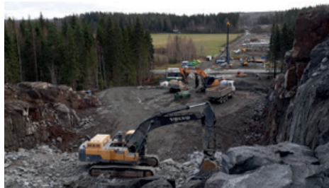
Kuvassa tielinjalla tapahtuu. Patiokalliolta itään tehdään töitä mm. kaivinkoneilla, paalutuskoneella ja kuorma-autoilla.