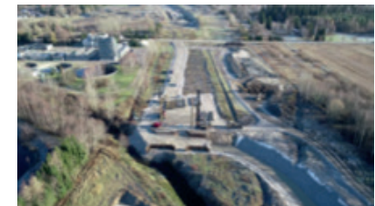
Ali-Juhakkalan sillan paalutus