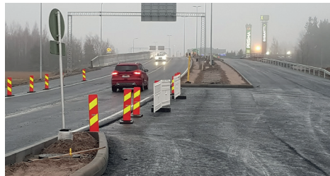
Launeen sillan länsireuna avattiin liikenteelle perjantaina 2.11.2018.