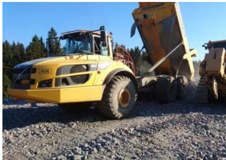
Kuvassa Dumpperi ja puskukone rakentamassa louhepenkerettä Soramäessä.