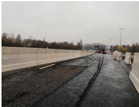
Melukaiteen asennusta Venetsian kohdalla.