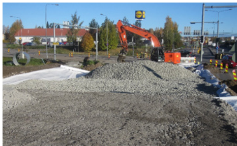
Kuvassa tehdään vaahtolasikevennyksiä.