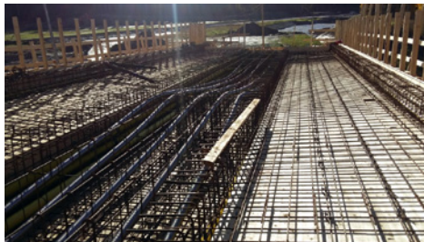
Kuvassa Ala-Okeroisten sillan kannen raudoitus valmistumassa.