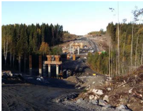
Kuvassa Vähäjoensillan pylväitä kohoaa korkeuksiin.