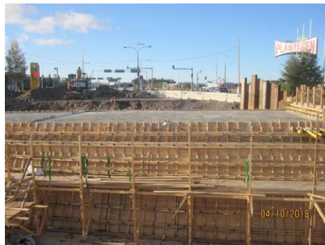
Kyöstilän alikulkutunneli betonoitiin kuluvalle viikolla.