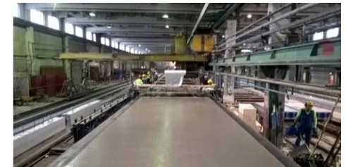
Patomäen kattorakenteessa käytettävän TT laatan numeron 1 valu käynnissä.