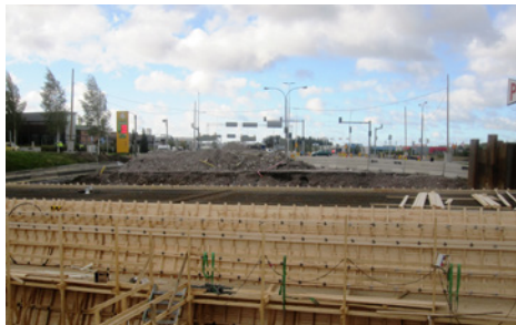
Kyöstilän alikulkukäytävä valmis valua varten.