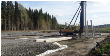
Kuvassa koepaalutukset käynnissä Takamaalla.