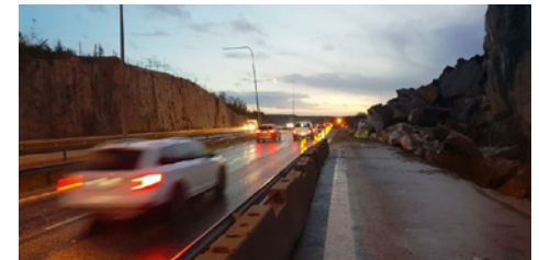
Kuvassa valtatie 4 kohta, josta siivottiin louhinnassa tielle pudonnut kivilohkare.