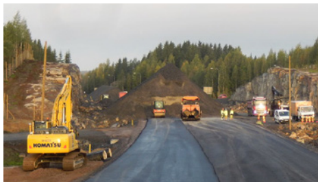
Kuvassa päällystystyöt alkaneet Soramäessä