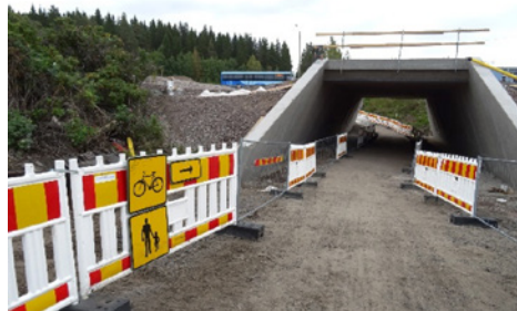
Jalankulku ja pyöräily Tasangonpolulla helpottui, kun uusi Patomäen alikulkukäytävä otettiin käyttöön.