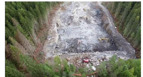
Liipolan tunnelin itäinen suuaukko viimeisen avolouhinnan jälkeen.