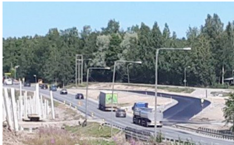
Kuvassa juuri päällystetty Okeroisten kiertotie.