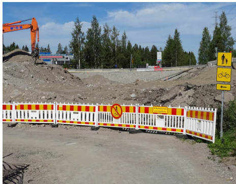
Purettu Aukeankadun alikulkukäytävä ja kiertotiet.