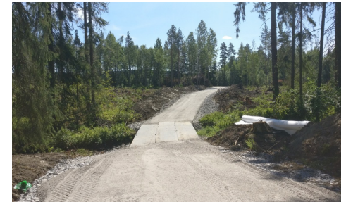
Luhdantaustankadun kevyenliikenteen kiertotien pohjat valmiina asfaltointia varten.