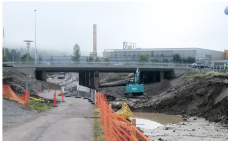
Hankaankadun rakentaminen käynnissä.