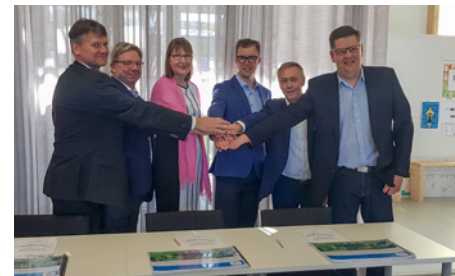
Tyytyväisiä ilmeitä toteutusvaiheen allianssisopimuksen allekirjoitustilaisuudessa.