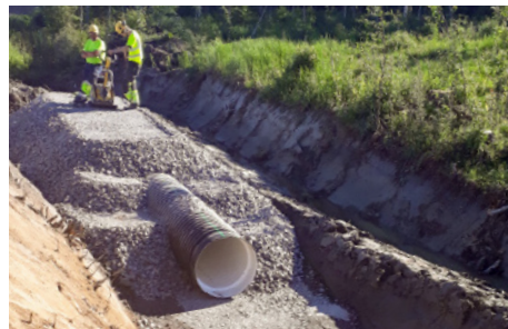
Kuvassa rummuntekoa Soramäen alueella.