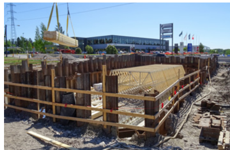
Kuvassa Nikkilän alikulkukäytävän sillan telinetyöt.