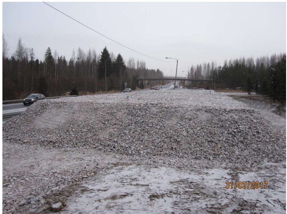
Kuva 1. Venetsian putkisillan (S4) esikuormituspenger

Venetsian putkisillan esikuormituspenkereen rakentamisen tarjous on saatu ja hankintapäätös tehty 14.3.2017. Putkisillan kohdan esirakennustyöt ovat valmistuneet maaliskuun aikana. Rakenteeseen lisätään vielä lisätyönä kuivatusputket huhtikuun aikana.