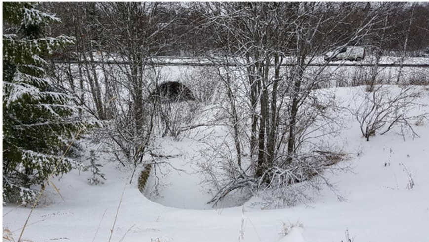
Kuva 1. Venetsian putkisillan esikuormituspenkereen kohde