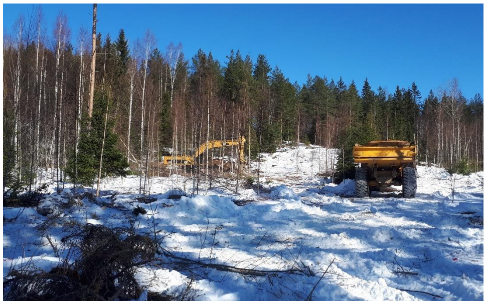
Kuva 2. Maankaivua Liipolan tutkimustunnelin kohdalta.

Maaliskuussa on jatkettu rakennustöiden suunnittelua ja aikataulutusta, ja tekniikkaryhmissä on viety suunnitteluratkaisuja eteenpäin.