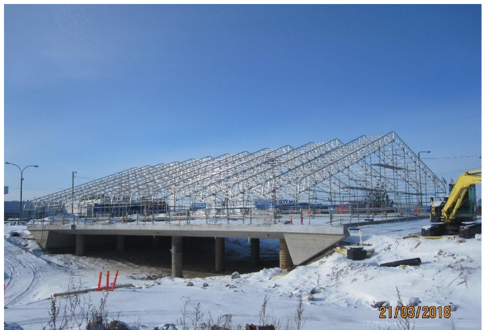
Kuva 3. Hankaankadun risteyssillan (S1) sääsuoja rakentumassa.

Maaliskuussa ei tehty merkittäviä muutoksia liikennejärjestelyihin.