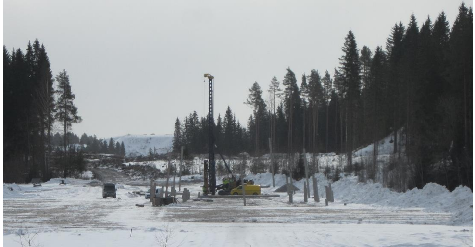
Kuva 1. Koepaalutusta Luhdanjoen sillan (S9b) itäpäässä