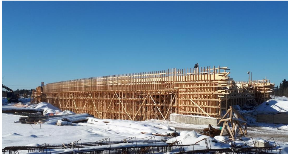
Kuva 4. Launeen risteys sillan (S24) kannen telinettä