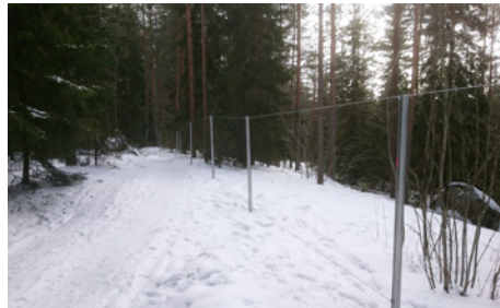
Aitaa valmistumassa työalueen rajalle Liipolassa.