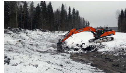
Kuvassa kaivinkone tekee kuivatuksia.