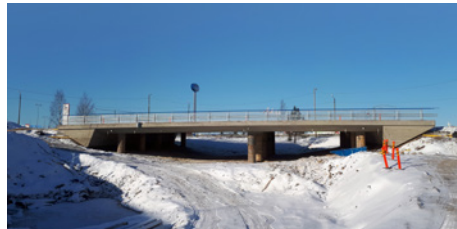
Hankaankadun risteyssillasta on saatu telineet ja muotit purettua.