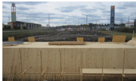
Kuvassa ovat alkamassa Patomäen alikulkutunnelin raudoitustyöt.