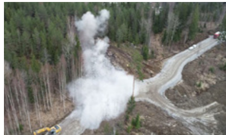
Louhintaräjätys ensimmäisellä tutkimustunnelilla.