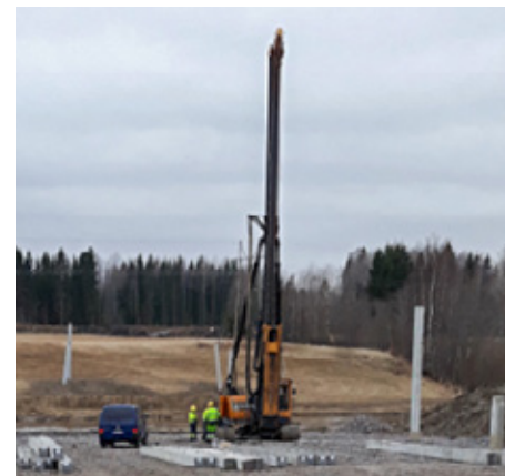
Kuvassa paalutustyöt ovat alkamassa Okeroisissa.