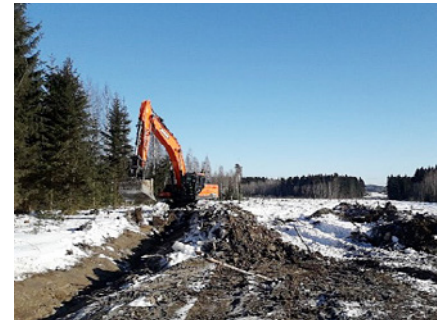
Kaivinkone tositoimissa tekemässä kulkuteitä ja kuivatusta työmaalle Okeroisten tulevan eritasoliittymän itäpuolelle.