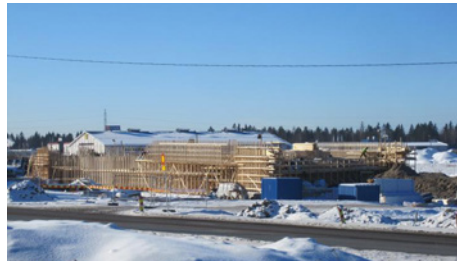
Launeen risteyssillan teline kylpee auringonvalossa