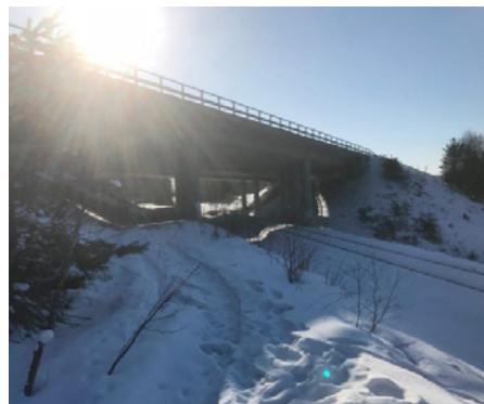
Aurinkoinen Lepolan ylikulkusilta kuvattuna maastomittausten yhteydessä.