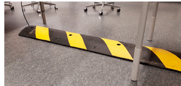
Myös toimiston työturvallisuuteen kiinnitetään huomiota.

Tällä viikolla ST-roomissa on paneuduttu hankeosan 1A massamääriin ja massojen hallintaan. Vesistöjen tutkimukset alkavat jo helmikuun loppupuolella. Toivotaan, etteivät hankeosan alueella olevat joet ja purot ehdi jäätyä ennen näytteiden ottamista. Lisäpohjatutkimukset ovat loppusuoralla, eikä haastava keli ole hidastanut kairavaunujen etenemistä työmaalla.