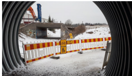
Kuvassa käynnissä Patomäen alikulun purku Tasangonpolun kiertotieltä katsottuna.