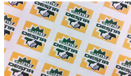
Hankeosan perehdytystarra on valmis.