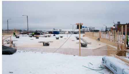
Näin hienosti etenevät työt Hankaankadun risteyssillalla.