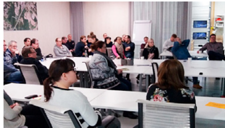
Valtarilaisia Big Roomissa kuuntelemissa CEEQUAL-sertifikaatin esittelyä.