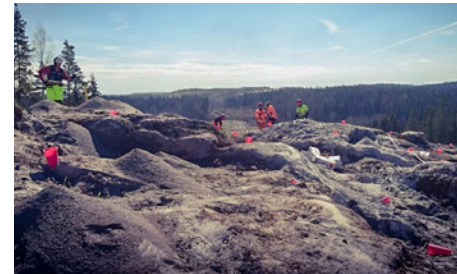
Kuvassa on käynnissä panostus Patiokallion työmaalla.