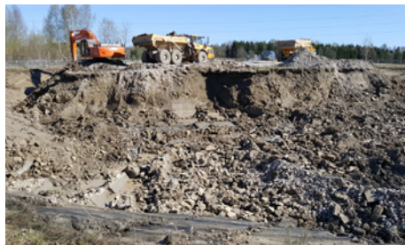
Patomäen koekaivannon avulla kerätään tietoa rakentamisen suunnittelun pohjaksi.