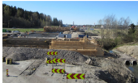
Launeen eritasoliittymän alueella ovat siltojen raudoitustyöt ja paalulaattojen teko täydessä vauhdissa.