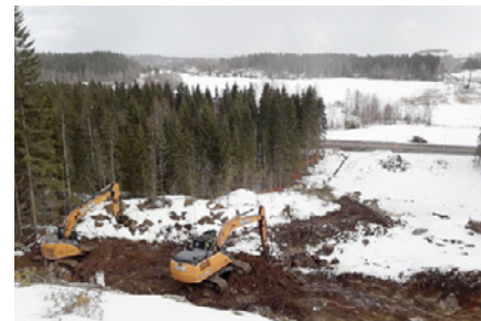
Kuvassa kaksi kaivinkonetta kuorii kalliota Patiokalliolla.