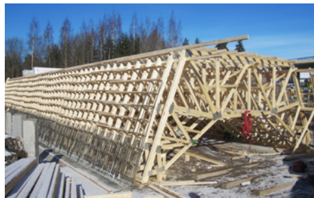
Launeen alikulkukäytävän muottityömaa kevättauringossa.