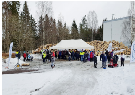
Jyrkänkadun asukastilaisuutta vietettiin talvisessa säässä.