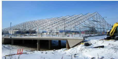
Hankaankadun risteys sillan sääsuojan rakentaminen vauhdissa Renkomäessä.