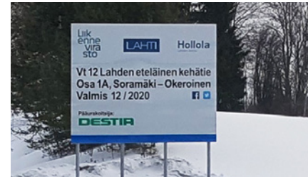
Työmaataulut saatiin paikoilleen maastoon.