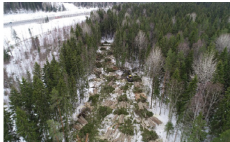
Puuston poisto käynnissä Kujalassa.