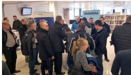
Keskustelu kävi vilkkaana hankintamarkkinoiden urakkatorilla.