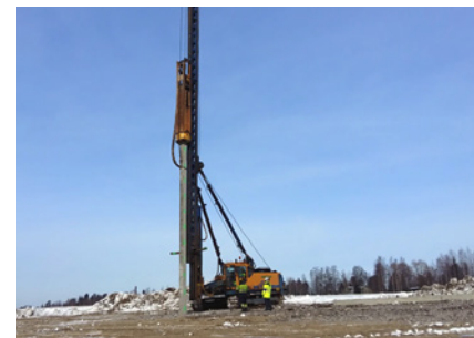
Koepaalutukset alkoivat Ala-Okerointien läheisyydessä.