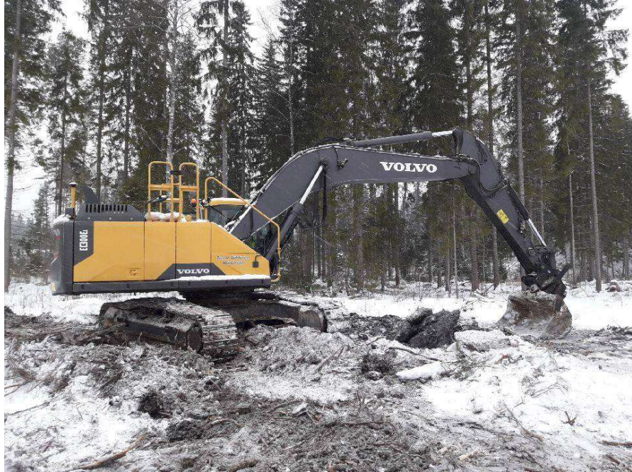
Kuva 1. Ensimmäinen kaivinkone aloitti työt ST-urakassa 12.2.2018.