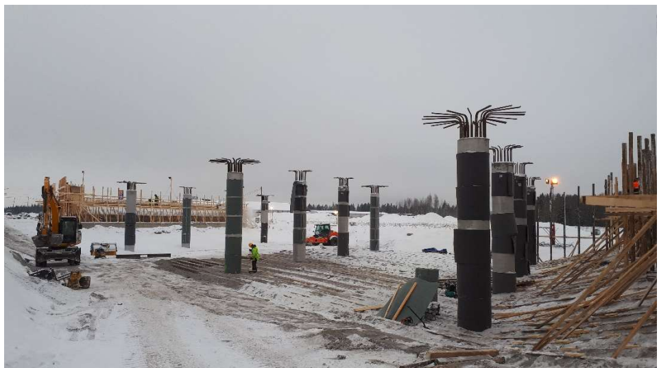
Kuva 3. Sillan S24 telineen valmistelua 7.2.