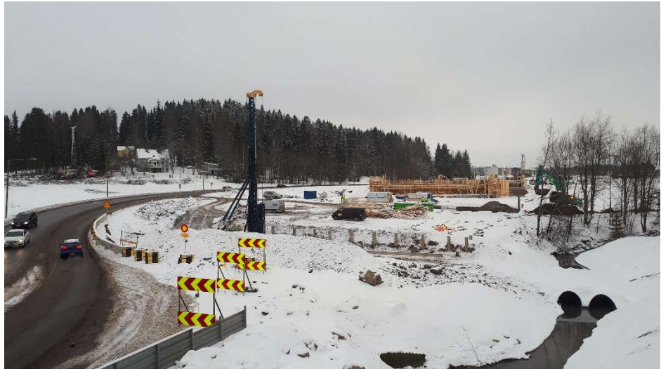
Kuva 4. S10-S24 siltapaikka 13.2.