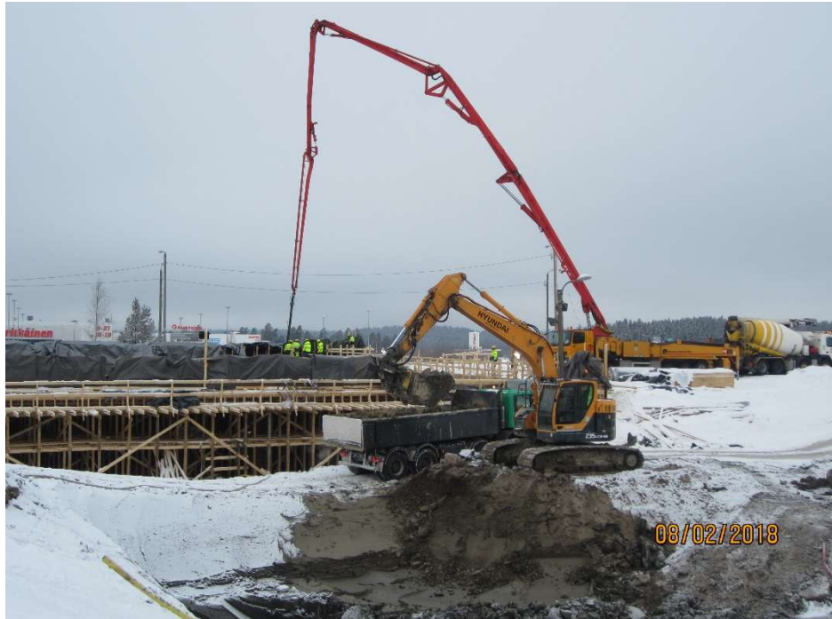
Kuva 2. Sillan S1 valu 8.2.

Helmikuussa ei tehty merkittäviä muutoksia liikennejärjestelyihin.